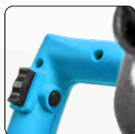
Bouton de déverrouillage