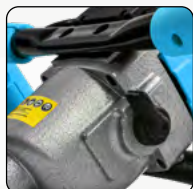
2 modes de vitesse : lent / rapide