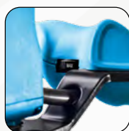
Régulateur de vitesse électronique