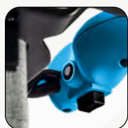
2 modes de vitesse : lent / rapide