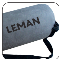
Sacchetto di recupero polvere 25 L (lavabile) con tracolla