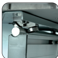
Carrello per tenoni con scorrimento su cuscinetti a sfera