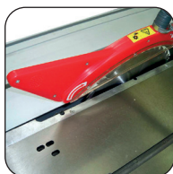
Carrello a filo lama da 2000 mm