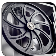
Volani in ghisa d'acciaio equilibrati