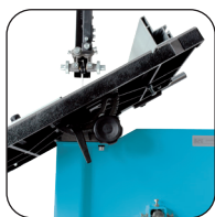
Banco inclinabile a 45°