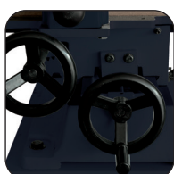
Doppia tornitura laterale e longitudinale su coda di rondine