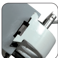
Scorrimento testa su coda di rondine