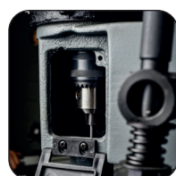
Sistema mandrino per fissaggio punta

Consultate le nostre 8000 referenze e trovare le opzioni di questa macchina sul nostro sito web