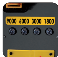
4 velocidades de rotación