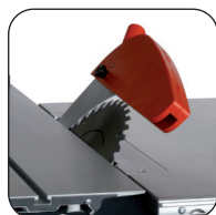
Carro junto a la hoja de 1320 mm, hoja con inclinación a 45°