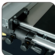
Guía de corte con ajuste micrométrico