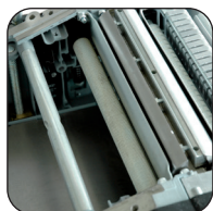
Rodillos de alimentación para el avance de la pieza de madera