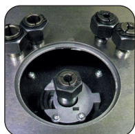
5 pinzas de apriete (6 - 6,35 - 8 - 12 - 12,7 mm)