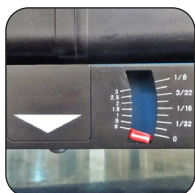
Indicador de profundidad de paso