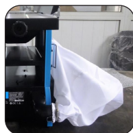
Sistema de aspiración integrado (con bolsa de recogida de virutas)