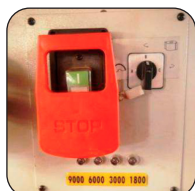
Tupí con 4 velocidades de rotación