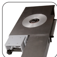
Prolongación de mesa de acero fundido y fijación oscilante para alimentador