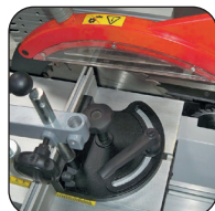
Carro junto a la hoja de 2000 mm, hoja Ø 315 o Ø 250 mm, incisor Ø 100 mm