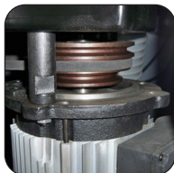
Tupí con 3 velocidades de rotación