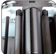
Árbol para regruesar de Ø 75 mm con 3 cuchillas 250 x 30 x 3 mm