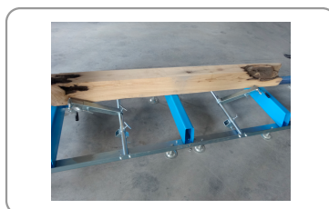
Systeem voor het bijhouden van houtblokken