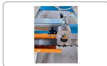
Guide de lame avec buse pour liquide de refroidissement