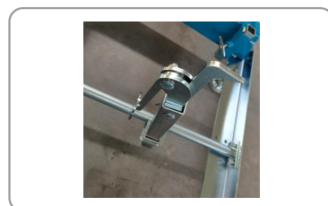
Griffe de maintien à serrage excentrique