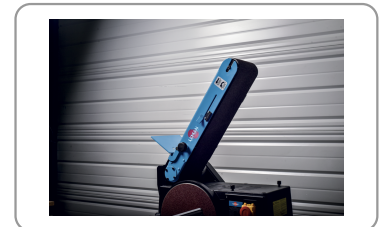
Band draait van 0° tot 90°