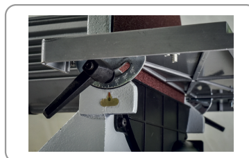
Tafel in gietstaal, kan tot 45° hellen