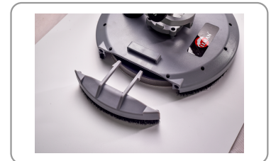
Afneembaar deel voor de hoeken