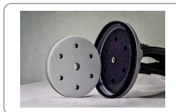
Schijfbevestiging op dubbelzijdig klittenband