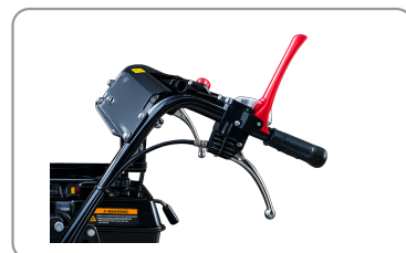
Poignée de sécurité "homme mort"