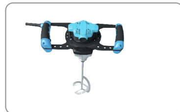
Poignées ergonomiques avec revêtement soft-grip.