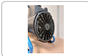
Ailettes canalisant le flux d'air