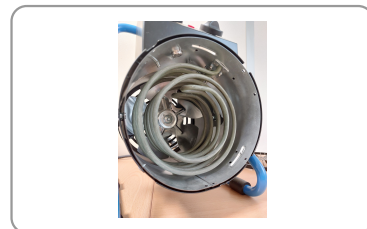
2 résistances indépendantes de 1500w chacune