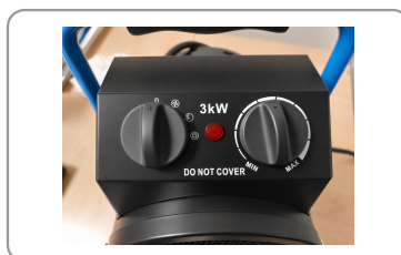
Fonction ventilation seule