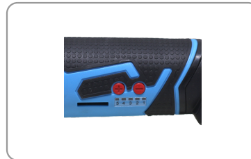
5 vitesses programmées.