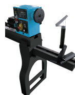
Verlengstuk en externe steun voor gereedschap