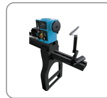
Verlengstuk en externe steun voor gereedschap