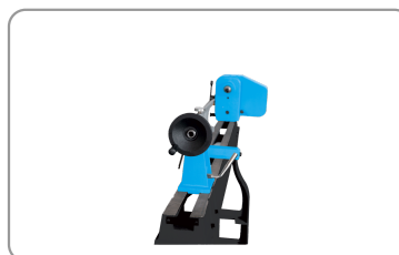
Vaste en mobiele meetbek geboord op 10 mm