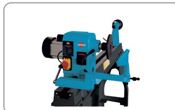
Rotatie van de kop jusqu'à 180°