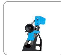
Vaste en mobiele meetbek geboord op 10 mm