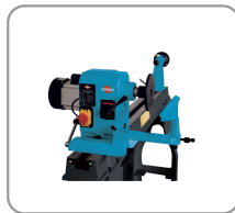
Rotatie van de kop jusqu'à 180°