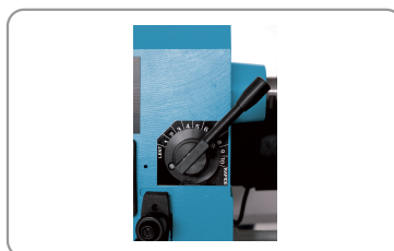
10 variabele snelheden van 500 tot 2000 rpm