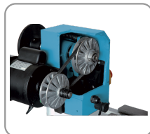
Motor met riem