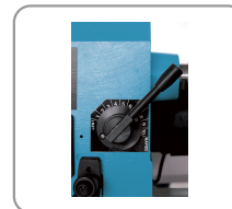
10 variabele snelheden van 500 tot 2000 rpm