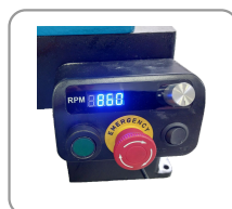
Boîtier de commandes magnétique