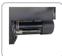
Moteur tefc à charbons pour un rendement optimal