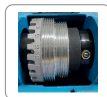
Indexation 24 positions