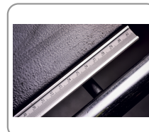
Geleider voor doorzagen in de lengte met micrometer afstelling