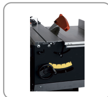
Zaagbladslede van 1320 mm, lame inclinable bij 45°