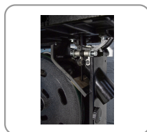
Geleider voor het bovenste en onderste blad met rollen