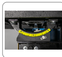
Tafel, kan tot 30^\circ hellen