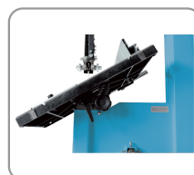
Tafel, kan tot 45° hellen