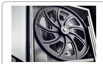
Uitgebalanceerde vliegwielen in gietstaal