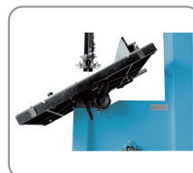
Tafel, kan tot 45° hellen