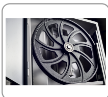
Uitgebalanceerde vliegwielen in gietstaal