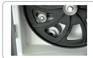
2 zaagsnelheden, voor hout en non-ferro metalen