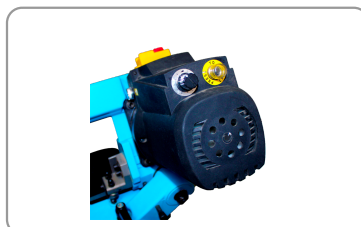
Snellheidsregelaar resetknop indicator voor stroominschakeling