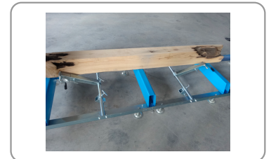
Systeem voor het bijhouden van houtblokken