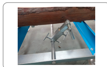
Systeem voor het bijhouden van houtblokken