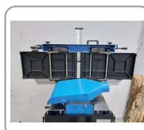
Ouverture des tables en une seule opération