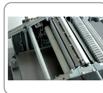
Aandrijvingsrollen voor de aanvoer van het stuk hout