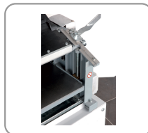
Schaafbank in gietstaal op 4 schroefvijzels