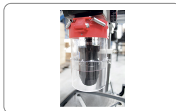
Kantelbare en afstelbare boorkopcarter