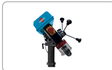
Pivoterende en radiale kop