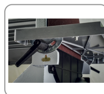
Tafel, kan tot 45° hellen