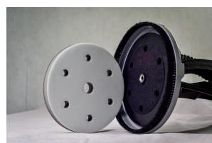
Schijfbevestiging op dubbelzijdig klittenband