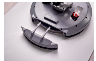
Afneembaar deel voor de hoeken