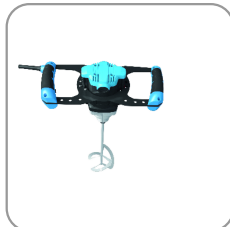
Poignées ergonomiques avec revêtement soft-grip.