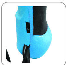
Molette de réglage.