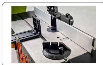
Tafel in gietstaal