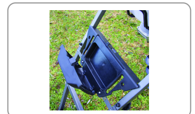
Boitier de rangement des accessoires