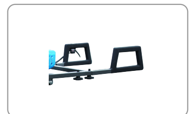
Poignées avec revêtement grip