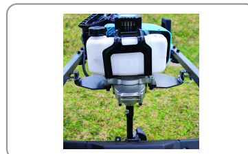
Montage du bloc moteur sur pivots