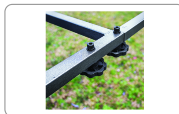
Châssis démontable sans outil