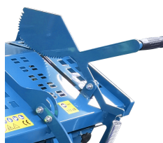
Protecteur supérieur avec poignée réglable et griffe de maintien de la bûche