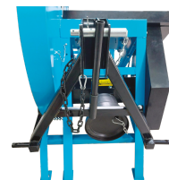
Attelage 3 points et entraînement sur prise de force.