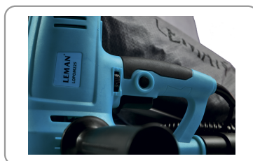
Vergrendelingsknop en toerenregelaar