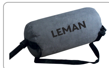
Opvangzak stof 25 l (wasbaar) met stekband