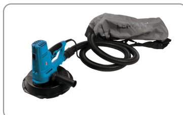
Schuurkop met profiel voor de hoeken