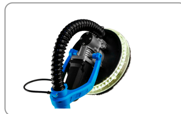
Led verlichting op schuurkop