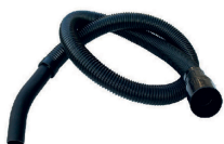
Flexibele aanzuigbuis 1,5 m