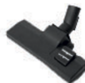
Pcv stof- en vloeist offenzuigmond