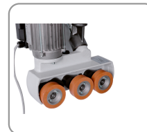
3 rollen van Ø 80