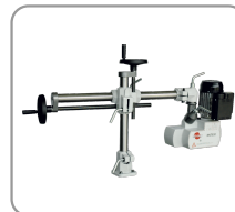
Uittrekbare arm van 610 mm