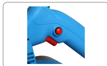
Molette de centrage de la bande.