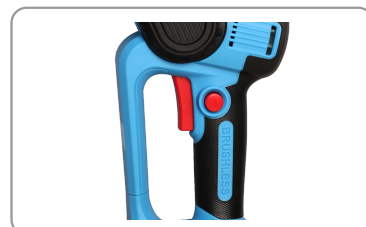
Compacte, légère, pratique et maniable.