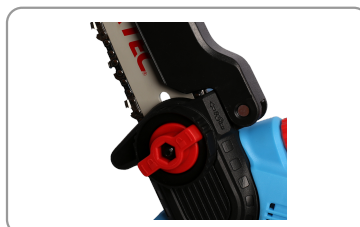
Changement de lame rapide et facile.