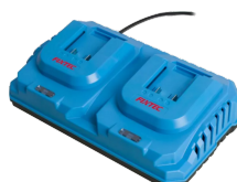
Chargeur rapide de batterie 20V Li-Ion